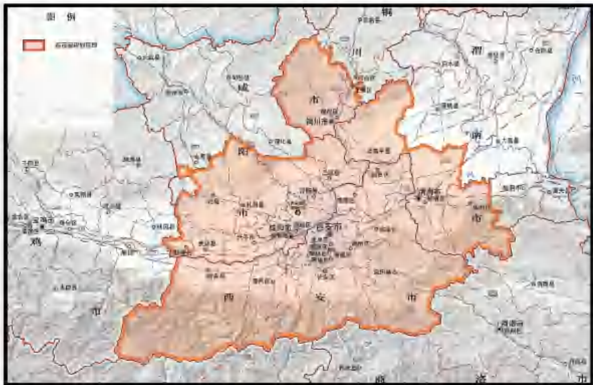
图 1 西安都市圈发展规划范围示意图