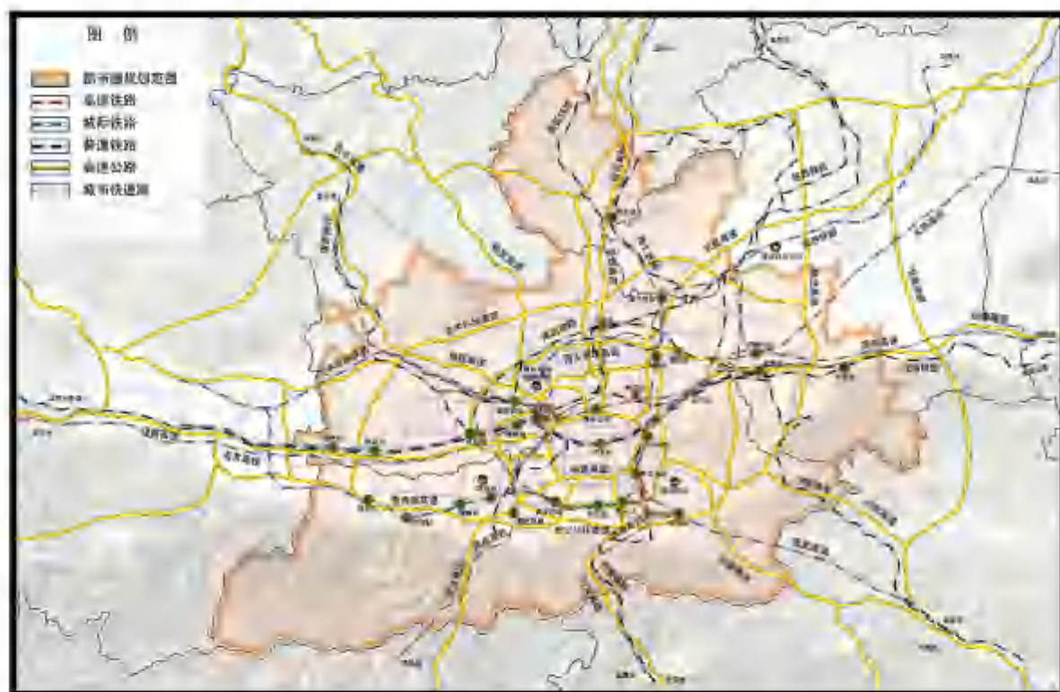
图3 西安都市圈轨道交通体系规划图

点、产业园区、配送（分拨）中心及物流企业协同联动、结链成网，实现一体化发展。大力发展多式联运，提高货物换装的便捷性、兼容性和安全性，加快形成“枢纽协同、陆空联动”物流发展新格局。