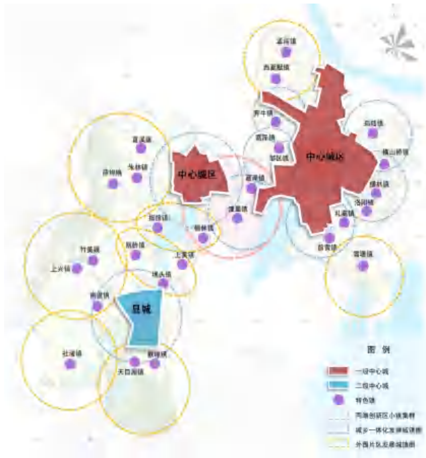
图 5 市域城镇体系规划图