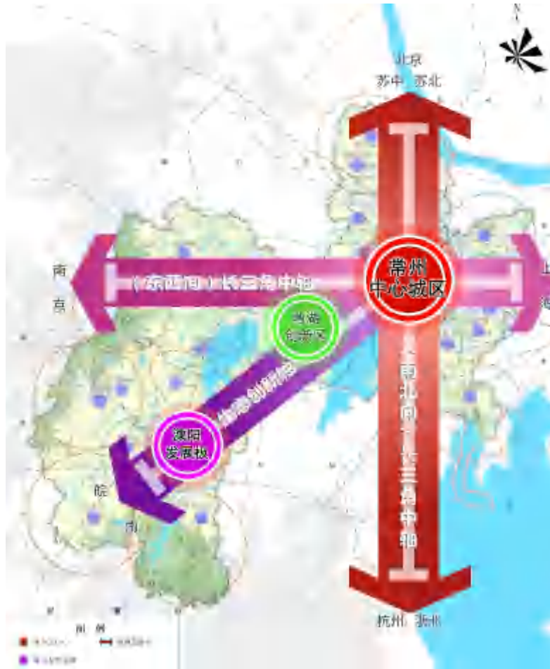
图 4 市域城镇空间格局图

优化市域城镇体系。按照“做强主城、做优县城、做特乡镇”的发展思路，构建“一级中心城-二级中心城-特色镇”的“2188”的市域城镇体系，推动中心城区—县城—特色小镇协调发展。“2”，即一级和二级两个中心城，一级中心城为常州中心城区，包括金坛、武进、新北、天宁、钟楼、经开区的集中建设区，是常州城市综合服务职能的主要承载地区，加快提高集聚区域人流、物流、信息流、资金流等要