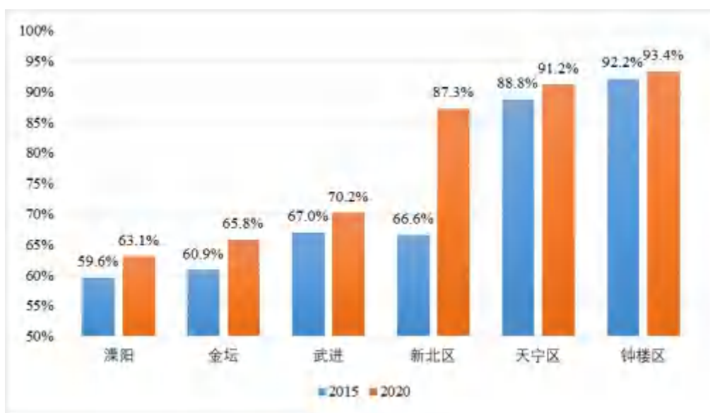
图3 各辖市(区)“十三五”城镇化率变化情况

城市现代化水平与居民安居乐业的需求仍有差距。能够满足中高端人才就业需求的岗位不足，五年新增城镇就业数量低于苏州、无锡、南京等地。公共服务、基础设施、住房等资源配置与人口流动的匹配度仍需提升，目前优质教育、医疗资源主要集中在钟楼、天宁等老城区，新城、产业园区资源配置相对落后。城市风貌特色不鲜明，文化韵味不突出。