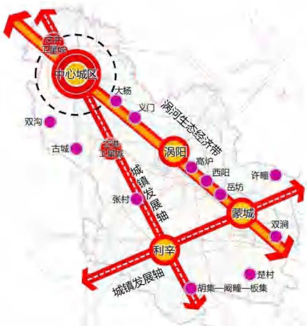
图 2 亳州市城镇化空间发展战略布局图